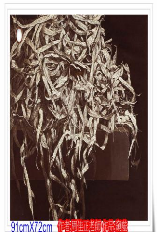
91cmX72cm 伊頓國語老師的作品

I am very grateful that God leads me to this southern part of Taiwan to teach English. Even though I am a teacher, I am still a learner: a learner to be simple, to be humble, to be sincere, and to be submissive just as the little children I serve.